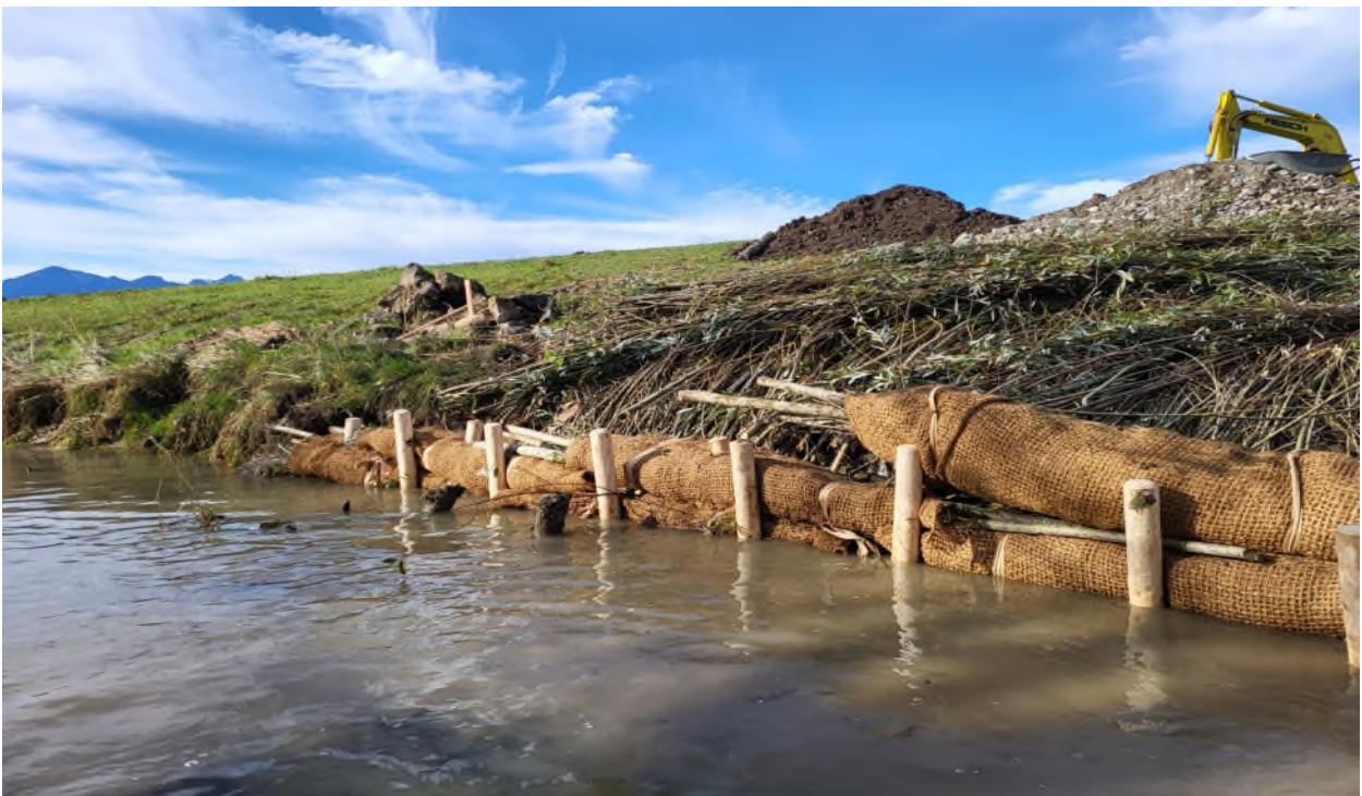
Abbildung 3: Die Kokossenkwalzen werden in den aufgegrabenen Uferbereich eingebettet. Holzpflocke sorgen dafür, dass sie nicht ins Wasser abrutschen können.