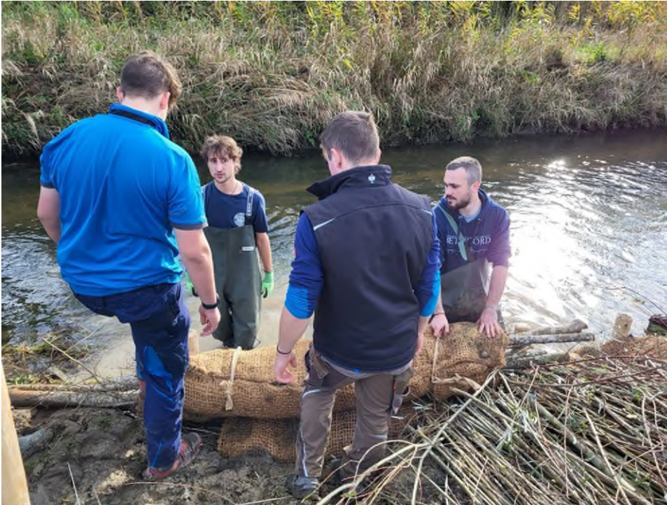
Abbildung 2: Beschriftung Zwei Stu- denten der FH Wei- henstephan-Triesdorf stehen in Wathosen im Rothgraben und neh- men die Bündel entge- gen, die ihnen zwei wei- tere Studenten heranrei- chen. Die sogenannten Kokossenkwalzen be- stehen aus Weidenäs- ten und Steinen, die in eine Kokosmatte einge- wickelt und fest ver- schnürt sind.