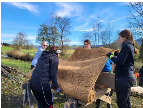
Abbildung 1: Studentinnen der FH Weihenstephan-Triesdorf bereiten eine Kokosmatte vor, in die die Weidenzweige eingewickelt werden.