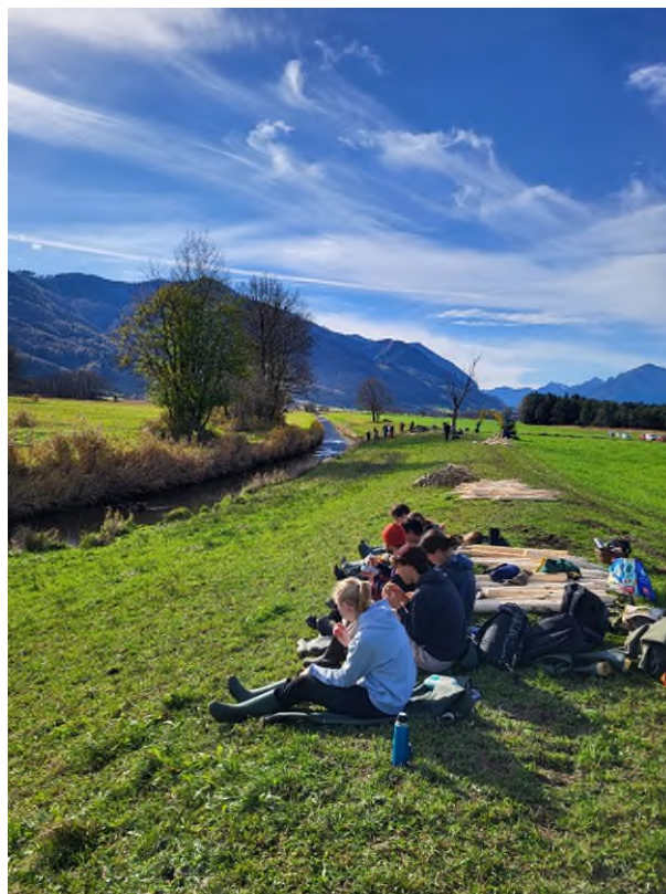
Abbildung 5: Brotzeitpause an der Lehrbaustelle im Bergener Moos, zwischen Bergen und Grabenstätt.