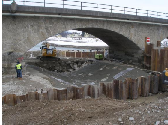
Absenkung der Wehrschwelle